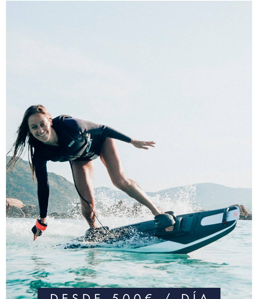
TABLA ELÉCTRICA DE SURF AWAKE BOARD