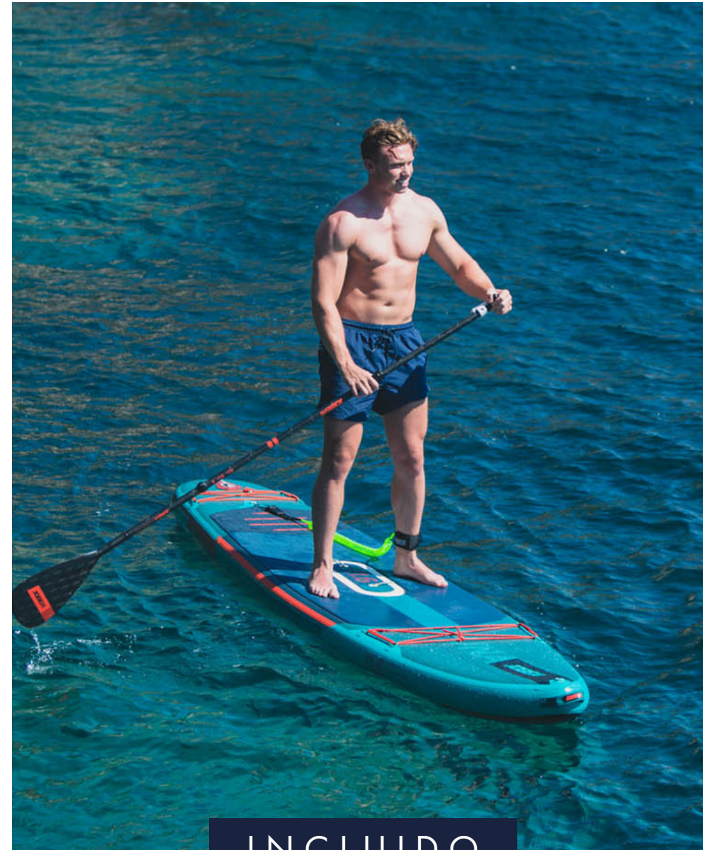
TABLA DE PADDLE SURF